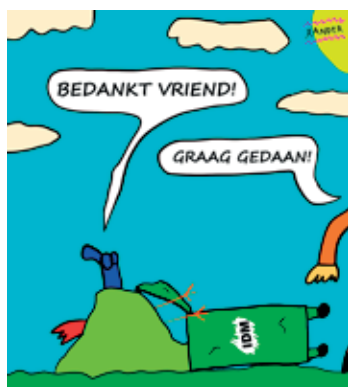
Deze cartoon werd speciaal voor IDM ontworpen door Xander, zie p. 16

Wil jij starten met thuiscomposteren? Wij helpen je alvast een eindje op weg, want de hele maand juni geven we je 20 % korting op alle composteersystemen, bovenop de voordeelprijs die je bij IDM al krijgt.